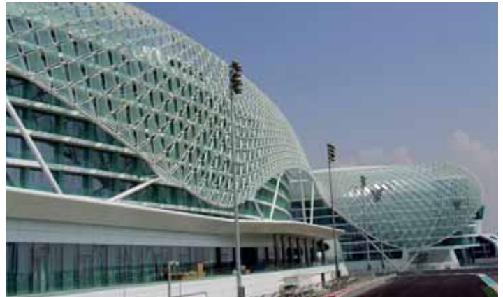
Yas Hotel, Abu Dhabi, VAR

Alle in dieser Druckschrift genannten Produkte sind Marken der AkzoNobel-Unternehmensgruppe. © Akzo Nobel 2015. AkzoNobel hat alle Anstrengungen unternommen um zu gewährleisten, dass die Informationen in dieser Druckschrift zum Zeitpunkt der Drucklegung korrekt sind. Falls Sie Fragen haben, wenden Sie sich bitte an den für Sie zuständigen Vertreter. Falls nicht in schriftlicher Form anderweitig vereinbart, unterliegen alle Verträge zum Kauf der in dieser Druckschrift genannten Produkte sowie unsere anwendungstechnische Beratung unseren Allgemeinen Lieferungs- und Zahlungsbedingungen.